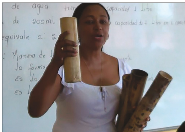
Foto 2. Profesora implementando la actividad

Posteriormente, las actividades diseñadas se llevaron al aula de clase con los estudiantes, por una de las profesoras que participó en su diseño (Foto 2).