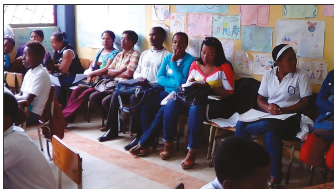
Foto 3. Maestros observando la clase

Los maestros al observar la actuación de su colega (Foto 3), reconocen en la realidad, situaciones que ocurren en su propia práctica y aquellas que no concebían. Diligenciar y seguir el guion les permitió analizar hechos que ocurren en la implementación de la actividad desde sus propios fundamentos. Entendemos que, de forma inicial, toman distancia de sus propias formas de concebir las situaciones de enseñanza y aprendizaje.