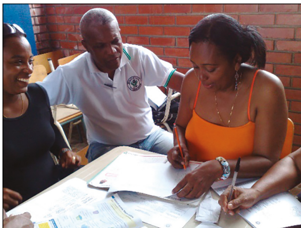
Foto 1. Maestros diseñando, en grupo, actividades de matemáticas

Dicha perspectiva sociocultural de la educación matemática aportó al menos dos elementos valiosos al diseño de las actividades: a) pensar las matemáticas como una actividad humana, social y cultural y b) reconocer y valorar en la cultura tumaqueña la existencia de ideas matemáticas extraescolares o etnomatemáticas.