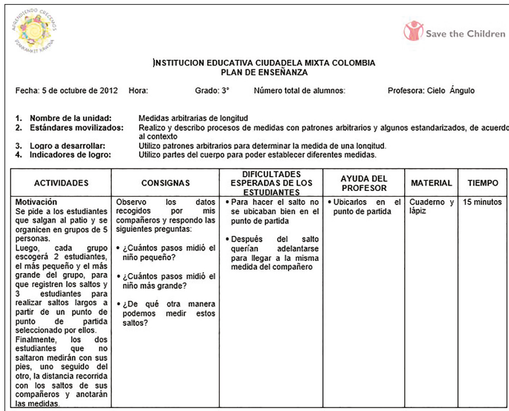
Figura 2. Guion de clase