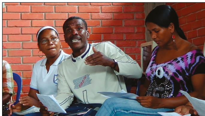
Foto 4. Maestros realizando la co-evaluación de lo sucedido en el aula de clase

Finalmente, se realizó el proceso de auto y co-evaluación y el posterior rediseño de las actividades (Foto 4). La estrategia de la autoevaluación, da origen a la explicitación de ideas y razones que justifican la actuación de los maestros; lo cual, conllevó a retomar la clase y hacer conciencia de los propios presupuestos. Con los aportes del grupo, los maestros logran identificar sus formas de ver la enseñanza de las matemáticas. Aunque no fueron profundizadas las creencias de los maestros en este momento, sí se explicitan algunas concepciones en relación al currículo, la gestión de la clase y la actuación de los estudiantes.